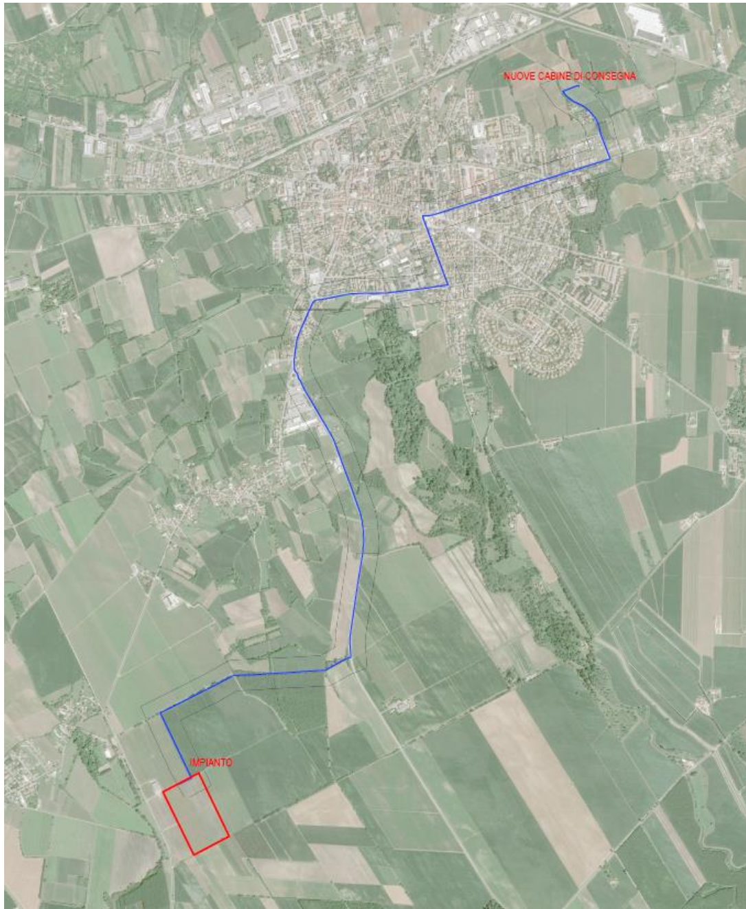
Figura 2 - Inquadramento dell'impianto FV e relative opere di connessione su ortofoto